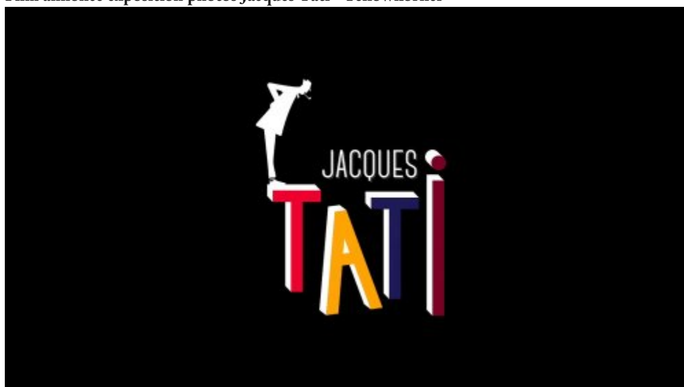
Film annonce exposition photos Jacques Tati - Yellowkorn (MPEG4)